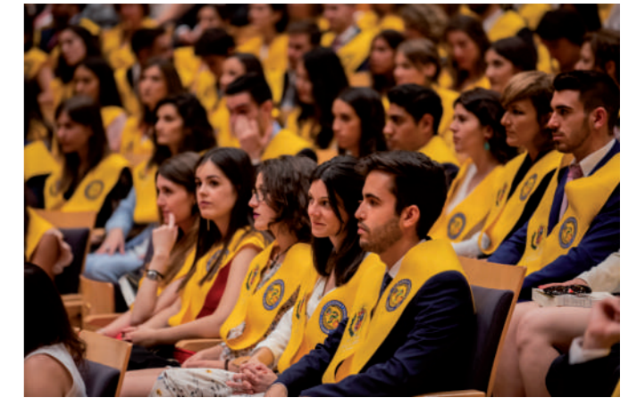
Alguno de los momentos vividos durante la jornada en el Auditorio de Zaragoza.