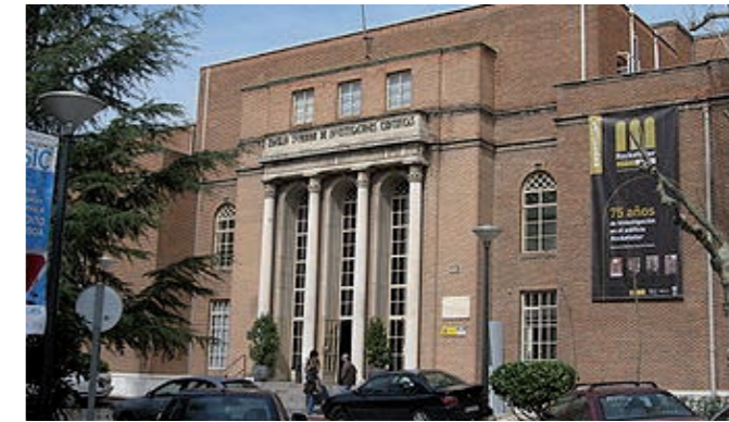
3. Edificio Rockefeller, fundado en 1919.

mediante la aplicación de radium. Expone que después de aplicarlo a dosis masivas, el paciente notó una sensación quemante y dolorosa en el antebrazo y erupción de vesículas muy diseminadas, lo que se diagnosticó de neuritis, como consecuencia de la acción del radium. Como conclusión, indica que se deben limitar las dosis masivas de radium cuando se trata de lesiones en la piel, en territorios ricos en terminaciones nerviosas.