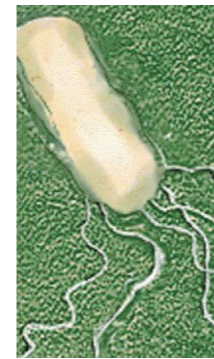
2. Bartonella quintana, también conocida como Rochalimaea quintana, responsable de la fiebre de las trincheras. Transmisible por piojos.