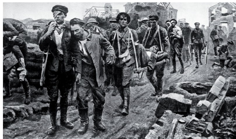
1. La fiebre de las trincheras ocasionaba miles de muertos.

El doctor Guzmán trata un nevus piloso en el antebrazo de un paciente