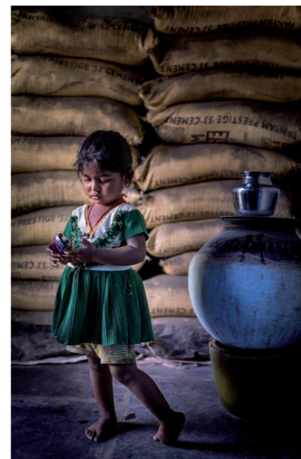
La mirada de seis fotógrafos se unen en la exposición "Desde la Ciudad del Infinito" de la Fundación Vicente Ferrer.