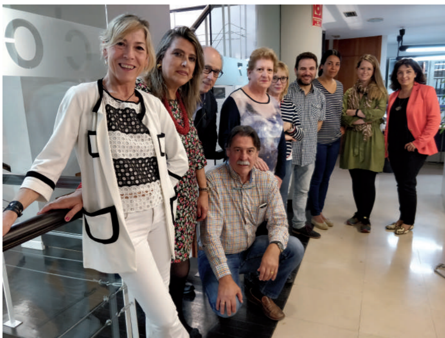
El Foro de Atención Primaria agrupa al Colegio de Zaragoza, Huesca y Teruel, SEMG Aragón; SEMERGEN; AEPap, SPARS, CESH ARAGÓN y FASAMET.

Constituido por los principales agentes representantes a nivel laboral, profesional y científico de la especialidad tiene como objetivo aunar fuerzas para defender el eje central del sistema sanitario