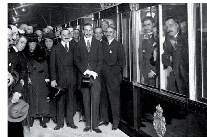
5. Inauguración del Metro de Madrid en 1919 por SAR el rey Alfonso XIII.