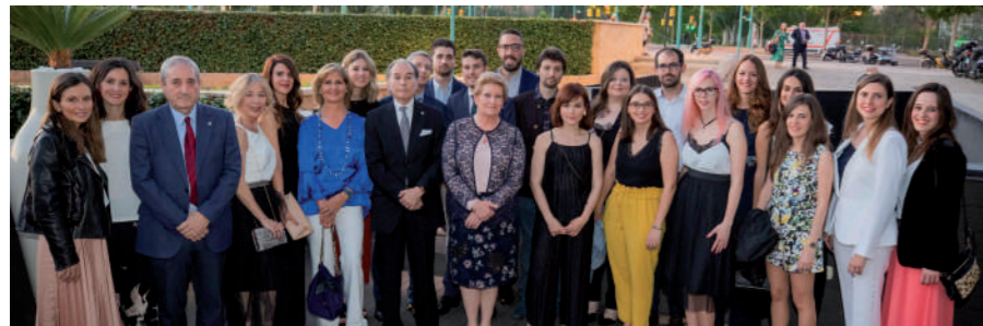
Los becados de este año durante la celebración del Día del Colegiado.