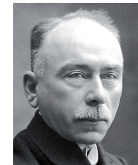
4. El Nobel de 1919: Jules Vincent Bordet

El belga Jules Vincent Bordet se doctoró en medicina a los 22 años. Trabajó en el Instituto Pasteur de París, en donde cultivó con éxito el campo de la inmunología. Dirigió el Instituto Pasteur de Bruselas y fue catedrático de Bacteriología de la Facultad de Medicina de la Universidad libre de Bruselas. Sentó las bases de la reacción de la fijación del complemento, describió el bacilo de la difteria en las aves domésticas y el de la tos ferina humana. Murió en 1961, a los 91 años de edad. Figura 4.