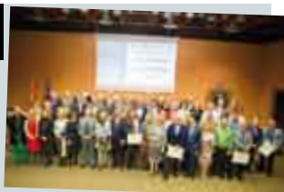
Día del Colegiado 2015