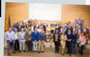
II Gala del Deporte