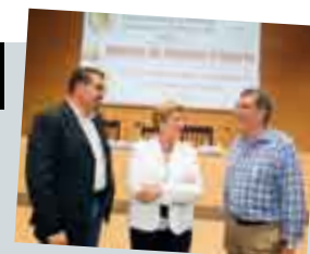
Jornada de Atención Primaria