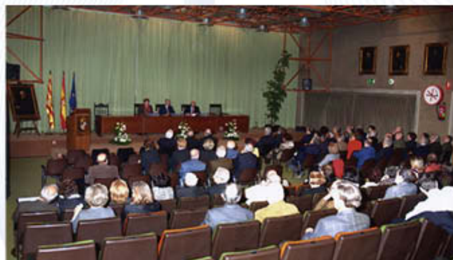
El Salón de Actos Ramón y Cajal durante el homenaje tributado a los médicos nacidos en 1945.