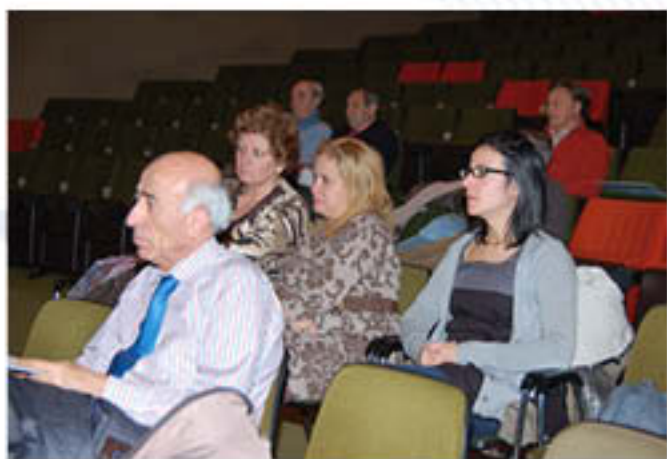
Colegiados y miembros de la Junta, durante la Asamblea.