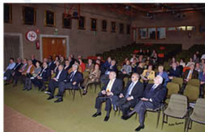
Aspecto del Salón de Actos durante el acto de homenaje a los médicos nacidos en 1945.