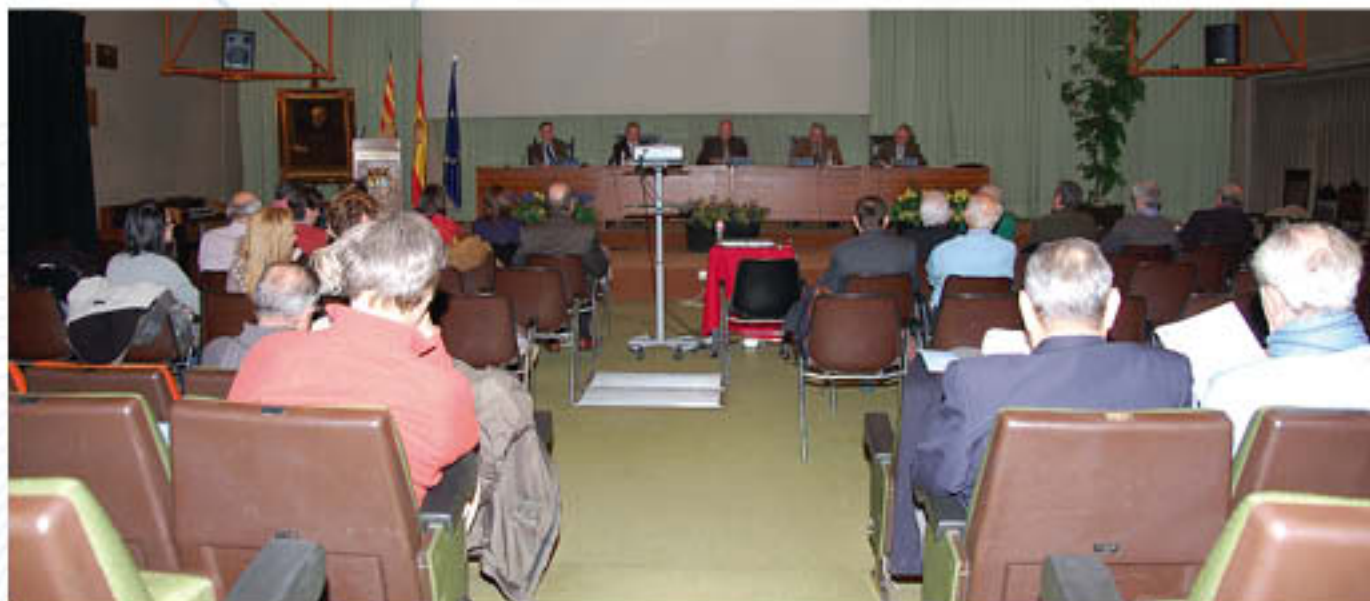
Aspecto del Salón durante la celebración de la Asamblea el pasado mes de diciembre.