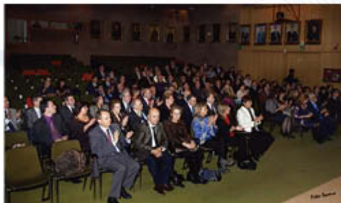
Aspecto del Salón de Actos durante la celebración del acto institucional.