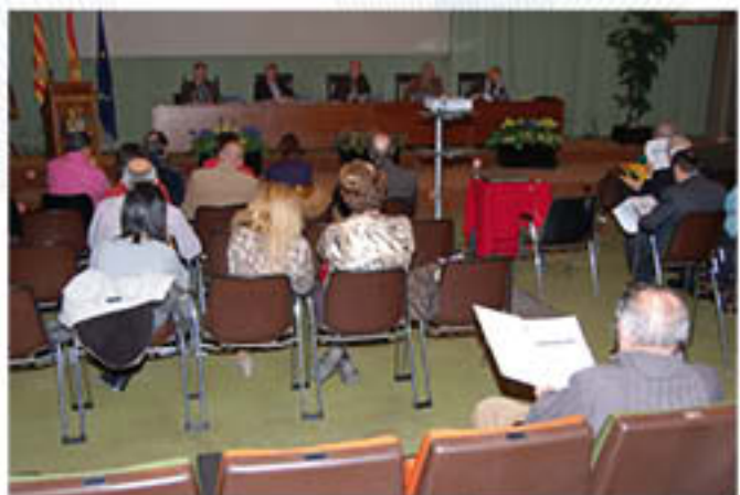
La aprobación de las presupuestos fue el asunto más destacado de la Asamblea.