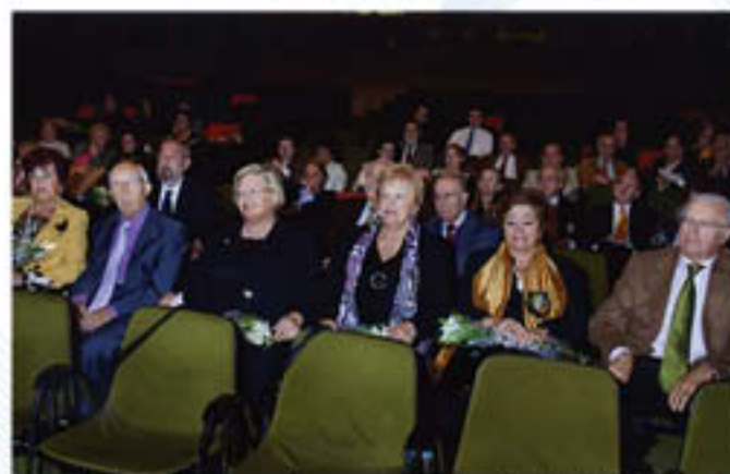
Los homenajeados compartieron un vino de honor al término del acto institucional.