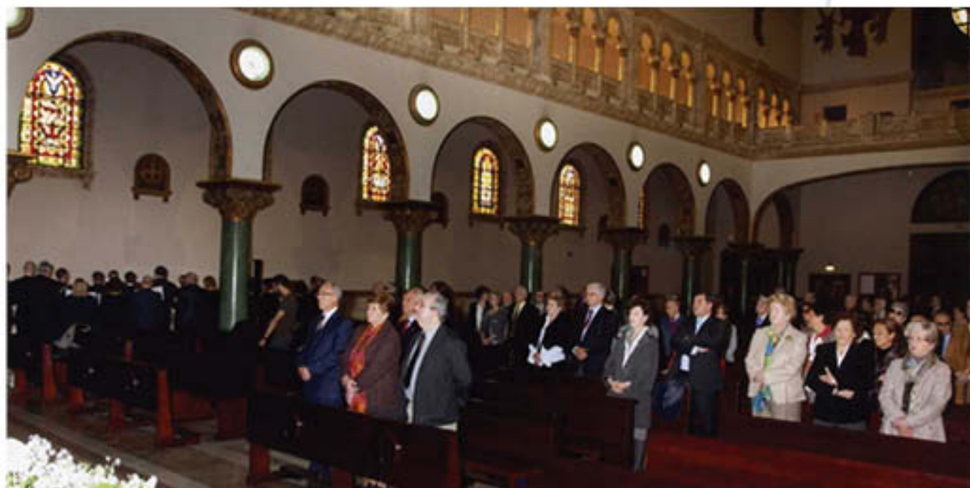
La Iglesia del Perpetuo Socorro acogió un año más la celebración de la misa en recuerdo de los médicos fallecidos. La participación destacada del Cero del Colegio solemnizó el acto religioso.