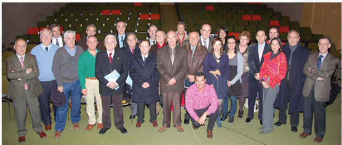
Fotografía "histórica" de familia con los participantes en la Asamblea ya que se trataba de la última reunión en el Salón antes de acometer su reforma.