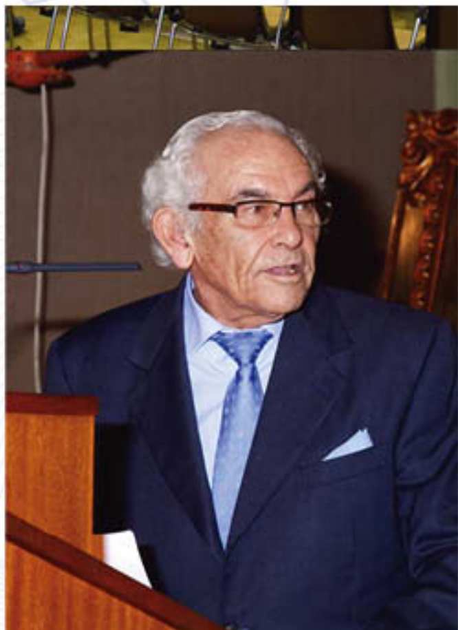
Los homenajeados compartieron un vino de honor al término del acto institucional.