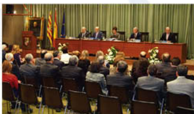
Un momento del acto institucional desarrollado en el Salón Ramón y Cajal.