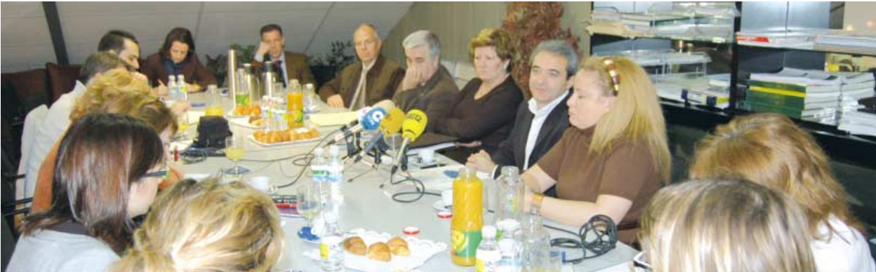
El Colegio de Médicos ha opinado sobre los problemas que afectan al servicio sanitario

Los usuarios del servicio sanitario acuden al médico, tanto en los centros hospitalarios como a la Atención Primaria, en situaciones que no requieren este tipo de asistencia. Este hecho, junto a la escasez de personal en algunas especialidades, fueron señaladas por el Colegio de Médicos como causas de los problemas en la atención.