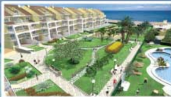
DÉNIA - ALICANTE