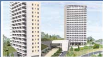
BENIDORM - ALICANTE