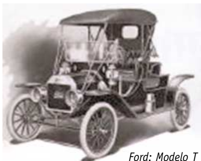
Ford: Modelo T

Nicolás Joseph Cugnot (1771) creó un dispositivo para mover cañones con tres ruedas y caldera de vapor.