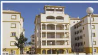
MAR DE CRISTAL - MURCIA