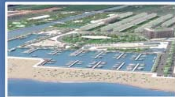
MONCÓFAR - CASTELLÓN