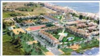
TORREBLANCA - CASTELLÓN