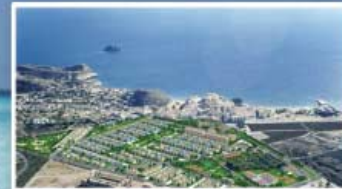
PULPÍ - ALMERÍA